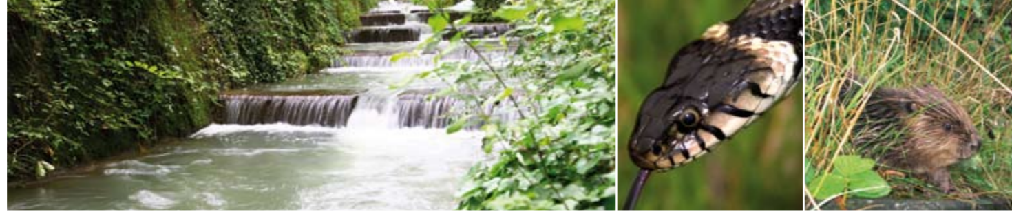
Ringelnatter, Biber und Kartäusernelke

Auf einer Länge von 230 Metern überwinden die Fische die Staustufe am Wasserkraftwerk.