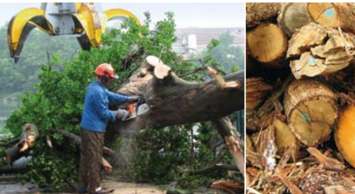
Angeschwemmtes Treibgut, sogenanntes Geschwemmel, wird aus dem Rhein gezogen und umweltgerecht entsorgt.