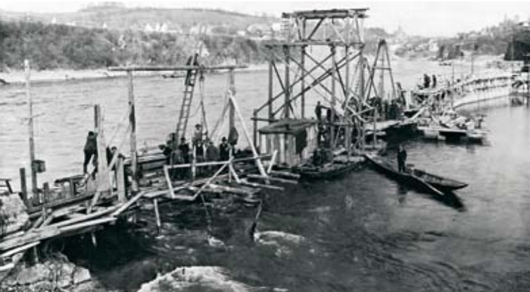
Mehr als 1.200 Bauarbeiter waren in Hochzeiten gleichzeitig auf der Baustelle beschäftigt.

1908 wurde das Unternehmen „Kraftwerk Laufenburg“ (heute Energiedienst Holding AG) gegründet um ein Wasserkraftwerk zu errichten und zu betreiben. Der Standort Laufenburg ist ideal für eine Wasserkraftanlage, da nach der Eiszeit durch einen Riegel aus rotem Gneis eine enge Schlucht entstand, unterhalb der sich der Rhein auf rund 200 m wieder verbreitert. Der Bau des Wasserkraftwerks zwischen 1909 und 1914 war ein architektonisches und flussbauliches Wagnis, denn das Kraftwerk in Laufenburg wurde als erstes quer zum Fluss gebaut. Noch heute ist Laufenburg klassisches Vorbild für moderne Laufwasserkraftwerke. Mit einer Leistung von 40 Megawatt (MW) war es damals das leistungsstärkste in Europa, die Jahresstromproduktion der ursprünglich zehn Francis-Maschinen-Gruppen lag bei 310 Millionen Kilowattstunden (kWh). Doch aufgrund des rasch steigenden Energiebedarfs wurde das Kraftwerk Laufenburg schon Ende der 1920er Jahre erstmals ausgebaut. Weitere Modernisierungen folgten. Seit 1994 produzieren zehn moderne Straflo-Maschinen-Gruppen Strom mit einer