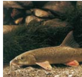
Die Barbe ist im Bereich des Wasserkraftwerks Laufenburg der am häufigsten vorkommende Fisch.

In Laufenburg können Fische das Kraftwerk mittels zweier Fischtreppe passieren. Die Fischwanderungen beginnen ab April bei steigenden Temperaturen mit dem Aufsuchen der Laichplätze. Sie erreichen ihr Maximum im Mai/Juni sowie September und enden mit der Rückkehr in die Winterquartiere im Herbst. Das Schweizer