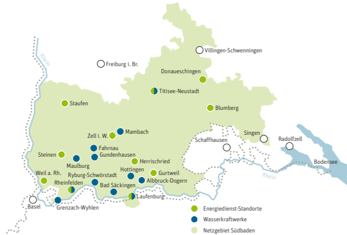
Rund 750.000 Menschen leben im Netzgebiet des regionalen Energieversorgers Energiedienst.

1908 wurde das Unternehmen „Kraftwerk Laufenburg“ (heute Energiedienst Holding AG) gegründet um ein Wasserkraftwerk zu errichten und zu betreiben. Der Standort Laufenburg ist ideal für eine Wasserkraftanlage, da nach der Eiszeit durch einen Riegel aus rotem Gneis eine enge Schlucht entstand, unterhalb der sich der Rhein auf rund 200 m wieder verbreitert. Der Bau des Wasserkraftwerks zwischen 1909 und 1914 war ein architektonisches und flussbauliches Wagnis, denn das Kraftwerk in Laufenburg wurde als erstes quer zum Fluss gebaut. Noch heute ist Laufenburg klassisches Vorbild für moderne Laufwasserkraftwerke. Mit einer Leistung von 40 Megawatt (MW) war es damals das leistungsstärkste in Europa, die Jahresstromproduktion der ursprünglich zehn Francis-Maschinen-Gruppen lag bei 310 Millionen Kilowattstunden (kWh). Doch aufgrund des rasch steigenden Energiebedarfs wurde das Kraftwerk Laufenburg schon Ende der 1920er Jahre erstmals ausgebaut. Weitere Modernisierungen folgten. Seit 1994 produzieren zehn moderne Straflo-Maschinen-Gruppen Strom mit einer